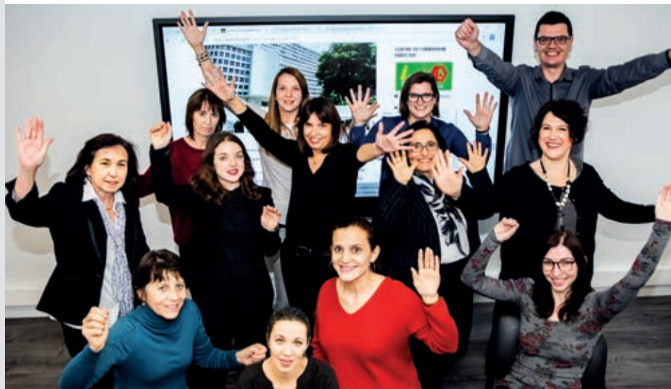
Équipe IFOCOP - Paris XIII®