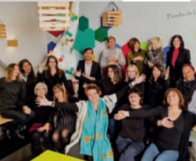
Équipe IFOCOP - Paris XI®

NB : 81% en 2014-2015 et 84% en 2015-2016