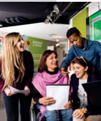
Stagiaires IFOCOP - Montigny-le-Bretonneux

Un objectif : l'emploi pour tous Une mission : aider les plus fragiles Une vocation : la reconversion