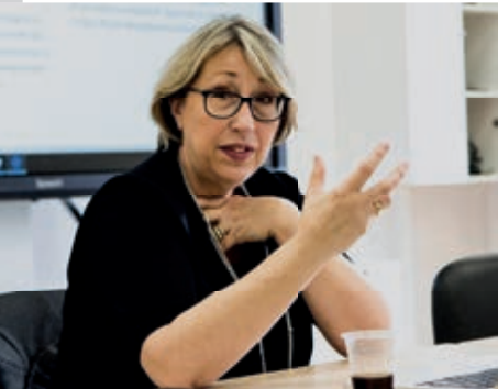
Marie-Anne Montchamp Ancienne ministre et directrice du cabinet d'études Maps Consultants Rapport « De la formation à l'emploi » - mai 2017